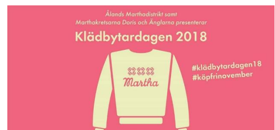
Även 2018 anordnades klädbytdagen i samarbete med Änglarna och Doris. Alla rekord slogs från föregående år, besökarna mer än nöjda och arrangörerna trötta men nöjda över att 1000 plagg fått ett nytt liv.