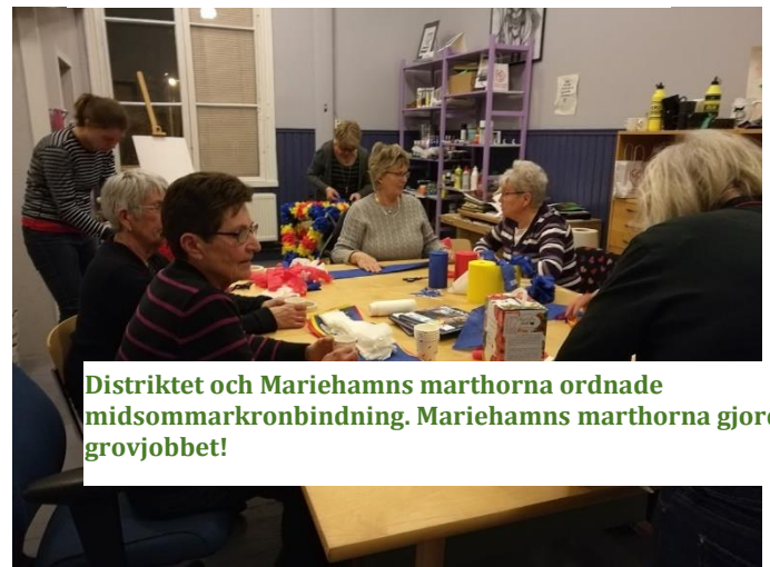
Distriktet och Mariehamns marthorna ordnade midsommarkronbinding. Mariehamns marthorna gjorde grovjobbet!