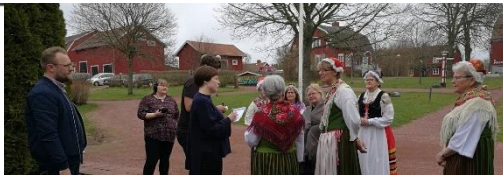
Distriktet tog på sig ansvaret att förmedla kunskap om de åländska folkdräkterna. Hemslojdssektionen har fått uppdraget då de besitter denna kunskap.