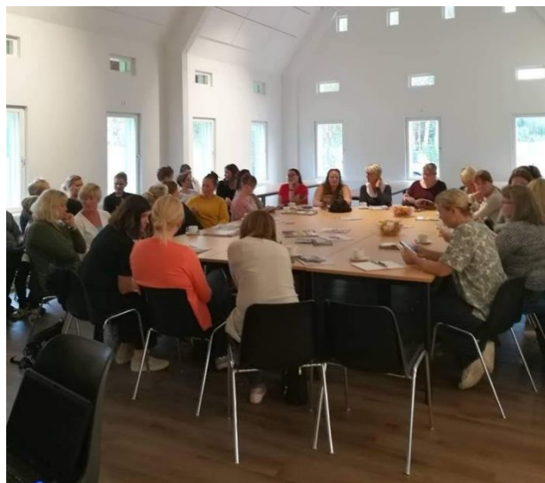
Doriskretsens första träff på Frideborg, september 2018

12 föreningar 5 kretsar 404 medlemmar 59,4 var medelåldern 32 stycken avgick 66 nya medlemmar 3 män