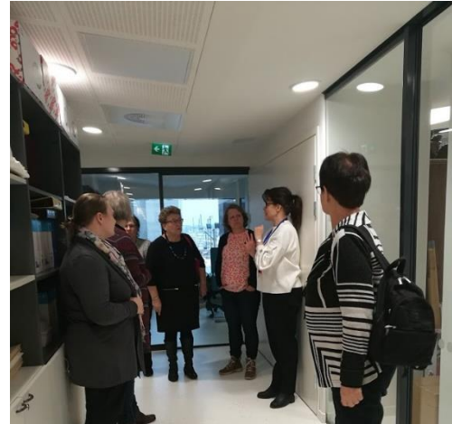
Kontakten med övriga Marthadistrikt har upprätthållits med t.ex. besök till Helsingfors. I det dagliga arbetet är kontakten god med Helsingfors Marthaförening som även de har anställda.