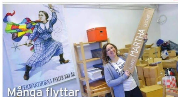
Vi har ökat vår synlighet och medierna visar ett intresse för vad Marthorna gör. Även krönikor skrivs av projektkoordinatorn.